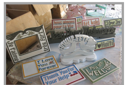
Leogane Chatuley #29 Tel: 3468-9916

Tanpri, rele oswa ale nan atelye nou yo diskite sou pwòjè ou a epi resevwa yon quote. Ou ka wè fini egzant travay nou yo ak aktyèlman wè atizan nou yo nan aksyon!