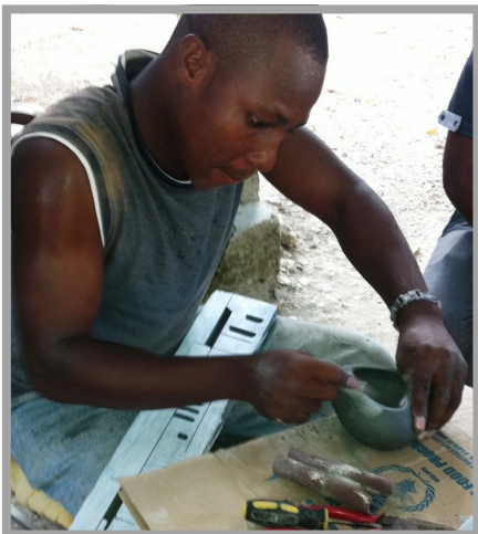
Leogane Chatuley #29 Tel: 3468-9916